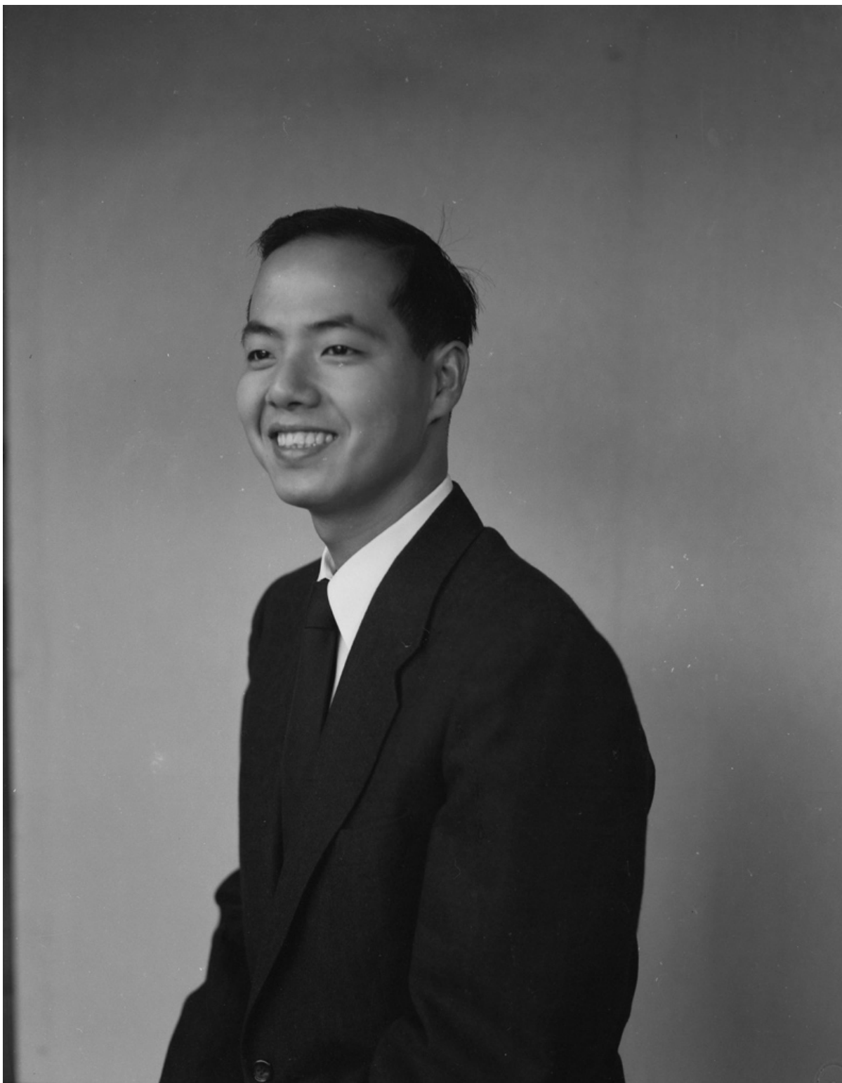
图1: 李政道先生1956年在普林斯顿高等研究院的照片

美籍华裔物理学大师李政道先生于2024年8月4日去世以后，他生前曾经工作过、举世闻名的普林斯顿高等研究院 (Princeton Institute for Advanced Study, 以下简称“研究院”) 不仅在其网页上及时发布了一篇长篇 悼文 ，而且公开了他在该研究院的一批珍贵档案资料。这些档案内容丰富，但为篇幅所限，本文将主要集中介绍其中关于李先生和二战后长期担任该院院长的著名物理学家奥本海默 (J. Robert Oppenheimer) 之间互动的资料，尤其是奥本海默为他写的多封热情洋溢的推荐信和证书，以帮助我们了解李先生的科学人生、乃至现代科学的发展史。