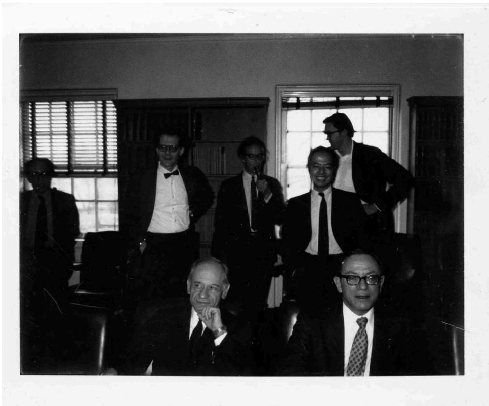
图3 李政道先生（右边中立者）1970年代初在普林斯顿高等研究院参加一个奥本海默纪念会